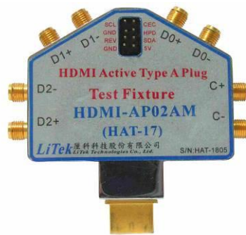
圖 3: HDMI-AP02AM, HDMI Active Plug 測試治具