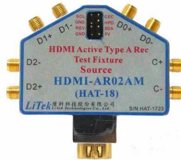
圖 2: HDMI-AR02AM, HDMI Active Rec 測試治具