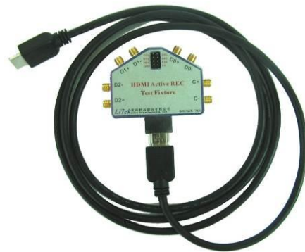
圖 4: HDMI Active Cable plugged into HDMI-AR02AM

在 HDMI ATC 協會中，無論被動的線材，或是加入主動元件的線材，都可以採用”眼圖測試”的方法來確認 HDMI Cable 是否符合規格的要求。但由於 HDMI ATC 所採用的設備相當昂貴，對於一般 HDMI Cable 製造商來說，是否採購這樣的設備成為相當困擾的一件事情。