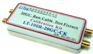
圖三: LT-100R-20GC-CK 校正