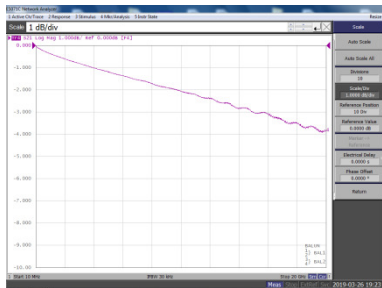
圖二: SDD21 校正

在開始使用 LT-100R-20GD-5P 治具量測 S 參數之前，我們必須先移除治具效應。其中一種方式是使用 LT-100R-20GC-CK 校正治具，量測校正治具的特性，再透過 AFR 將它分成兩段。另一種方式是量測 LT-100R-20GD 的 S 參數，然後將 S2P 檔轉成 S4P 檔。在移除這些損失效應後，測試治具的電子長度也會移除，可以應用在時域的量測上，進行相關的時域參數量測。