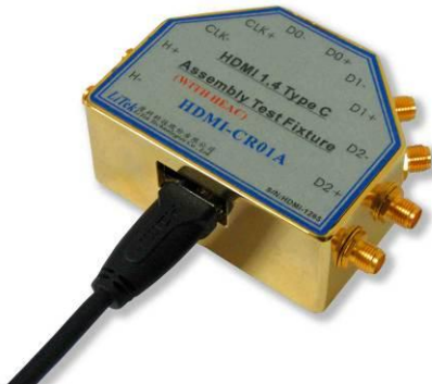
圖 2: HDMI-CR01A, 插上一條 HDMI C 的線材。

厘科科技的 HDMI-CR01A 是一個 HDMI C 的母座測試治具。此一治具除了可以用來測試具備 HDMI C Plug 的線材外，也可以用來測試連接一條 HDMI C 的線材到 HDMI Type C 母座的裝置。在測試治具上，擁有 5 對 SMA 的高頻接頭，可以用來與示波器或訊號產生器連接。治具上的特性阻抗，經過特殊設計，可以落於 95~105 Ohms 之間，且 5 對訊號的對內時間差都被設計小於 3ps 以內。