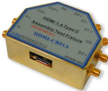
圖 1: HDMI-CR01A HDMI Type C 母座測試治具

厘科科技的 HDMI-CR01A 是一個 HDMI C 的母座測試治具。此一治具除了可以用來測試具備 HDMI C Plug 的線材外，也可以用來測試連接一條 HDMI C 的線材到 HDMI Type C 母座的裝置。在測試治具上，擁有 5 對 SMA 的高頻接頭，可以用來與示波器或訊號產生器連接。治具上的特性阻抗，經過特殊設計，可以落於 95~105 Ohms 之間，且 5 對訊號的對內時間差都被設計小於 3ps 以內。