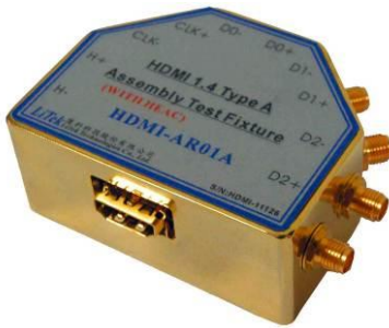
圖 1: HDMI-AR01A HDMI A 母座測試治具

厘科科技的 HDMI-AR01A 是一個 HDMI A 的母座測試治具。此一治具除了可以用來測試具備 HDMI A Plug 的線材外,也可以用來測試連接一條 HDMI A 的線材到 HDMI Type D 母座的裝置。在測試治具上,擁有 5 對 SMA 的高頻接頭,可以用來與示波器或訊號產生器連接。治具上的特性阻抗,經過特殊設計,可以落於 95~105 Ohms 之間,且 5 對訊號的對內時間差都被設計小於 3ps 以內。