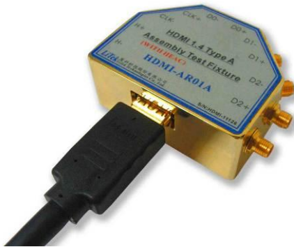
圖 2: HDMI-AR01A, HDMI-AR01A, 插上一條 HDMI A 的線材。

厘科科技的 HDMI-AR01A 是一個 HDMI A 的母座測試治具。此一治具除了可以用來測試具備 HDMI A Plug 的線材外,也可以用來測試連接一條 HDMI A 的線材到 HDMI Type D 母座的裝置。在測試治具上,擁有 5 對 SMA 的高頻接頭,可以用來與示波器或訊號產生器連接。治具上的特性阻抗,經過特殊設計,可以落於 95~105 Ohms 之間,且 5 對訊號的對內時間差都被設計小於 3ps 以內。