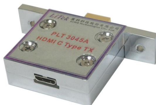
圖 3: HDMI Type C 測試治具