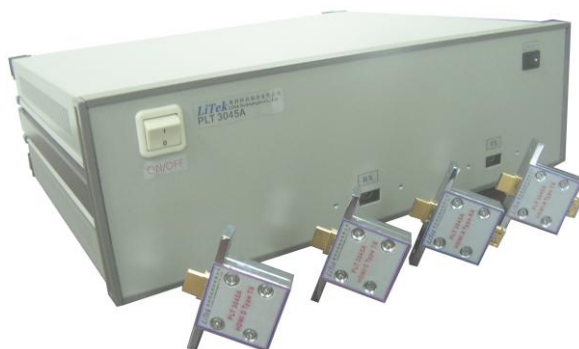
圖 1: PLT3045A 主機及測試治具

PLT3045A 是一台專門燒錄 HDMI with SynerChip Andy Cable 的燒錄儀器，此設備不同以往的燒錄儀器，儀器本身可以量測 HDMI 低頻、高頻訊號，另外亦可調整搭載「SynerChip Andy」的 Cable，透過軟體「Learning」的功能，軟體會動態調適「SynerChip Andy」的參數，自動選擇適當的參數值，進行後續相同特性的 Cable 燒錄依據。